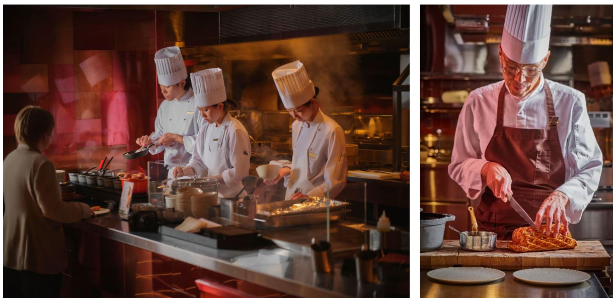
ゲストが自分で注文するライブキッチン

従来のようにウェーターが注文を取り運ぶ形式ではなく、ゲストはまず LED アートが彩る幻想的な通路を通り、活気あふれるライブキッチンエリアへと進みます。ここでは、シェフが目の前で調理を仕上げるライブ感を五感で楽しみながら、各ステーションで好みの料理をオーダーできます。