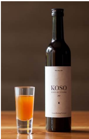
オリジナル酵素ドリンク 「KOSO COLLECTIONS plus」

ハイアット リージェンシー 東京(所在地:東京都新宿区西新宿 2-7-2、総支配人:高沢朝美)のスパ&ウェルネス「ジュール」では、花粉の季節の不快感をやわらげる「花粉すっきりスパプラン」を、2018年2月1日(木)より5月31日(木)までご提供します。